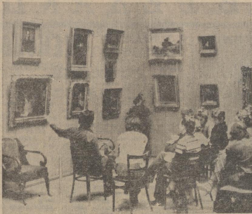
На снимках: в залах Третьяковской галереи занимаются многочисленные кружки любителей живописи; у мадонны Рафаэля — одного из спасенных советскими войсками шедевров Дрезденской картинной галереи в ГДР.