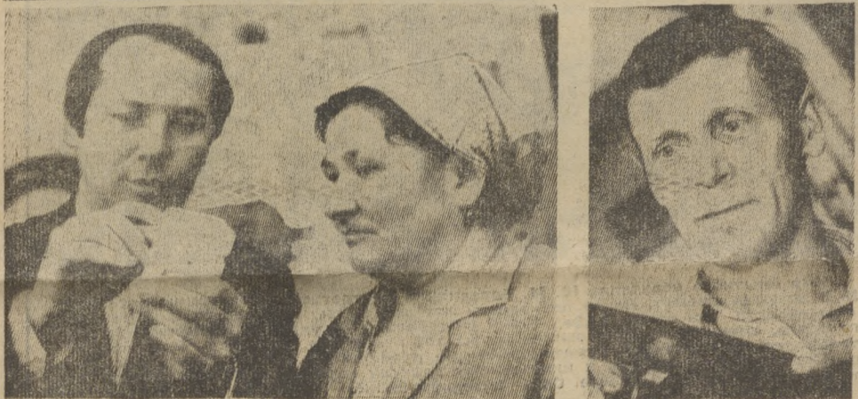
* У инициаторов соревнования в честь XXVII съезда КПСС