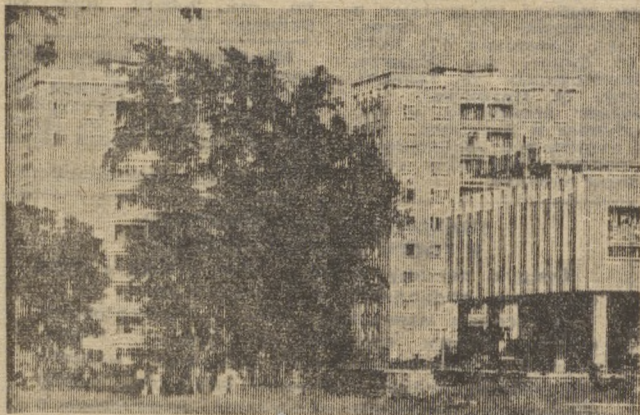
На улице Ленина, одной из самых старых в городе, наступило время перемен. Пока самая красивая часть улицы вот эта — здесь расположены магазины, девятиэтажные дома. Строительство нового микрорайона внесет существенные перемены в ее облик.