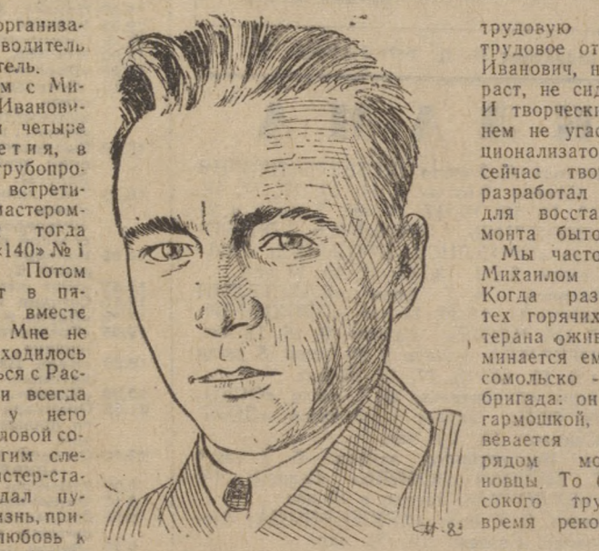
Почти восемь десятков лет за плечами. Лучшие годы жизни отданы строительству и становлению Новотурбунского завода.