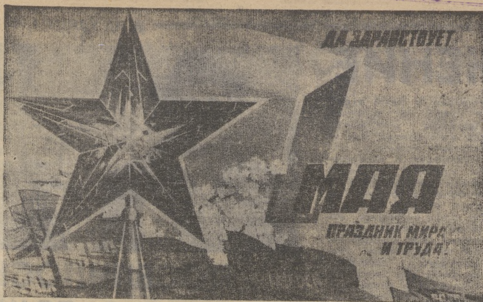
Плакат художника В. Викторова. Издательство «Плакат».

ТРУДЯЩИЕСЯ СОВЕТСКОГО СОЮЗА! ШИРЕ РАЗВЕРТЫВАЙТЕ СОЦИАЛИСТИЧЕСКОЕ СОРЕВНОВАНИЕ ЗА ДОСТОЙНУЮ ВСТРЕЧУ XXVII СЪЕЗДА КПСС! НОВЫМИ ДОСТИЖЕНИЯМИ В ТРУДЕ ОЗНАМЕНУЕМ СЪЕЗД РОДНОЙ ЛЕНИНСКОЙ ПАРТИИ!