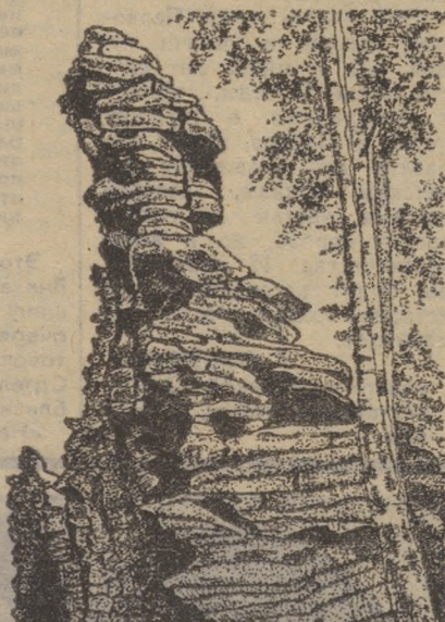
Рисунки Ю. Коршева.