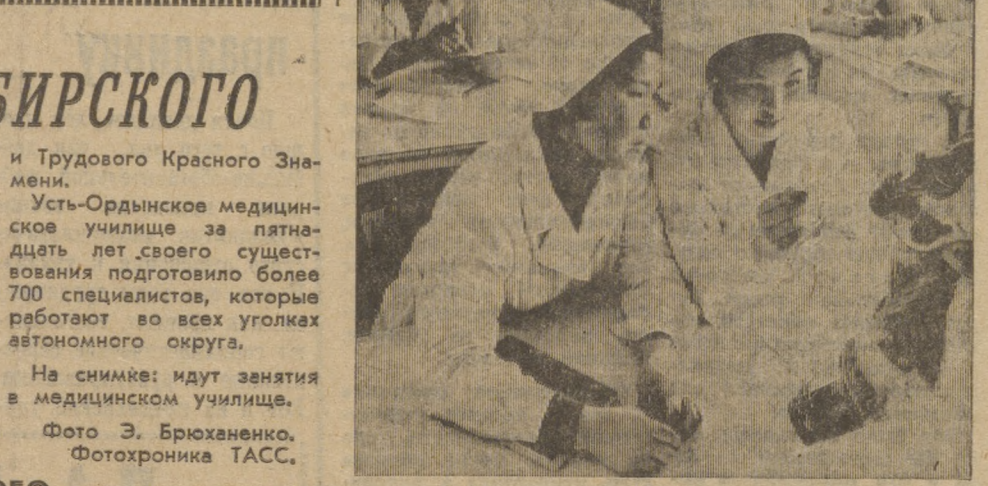
На снимке: идут занятия в медицинском училище.