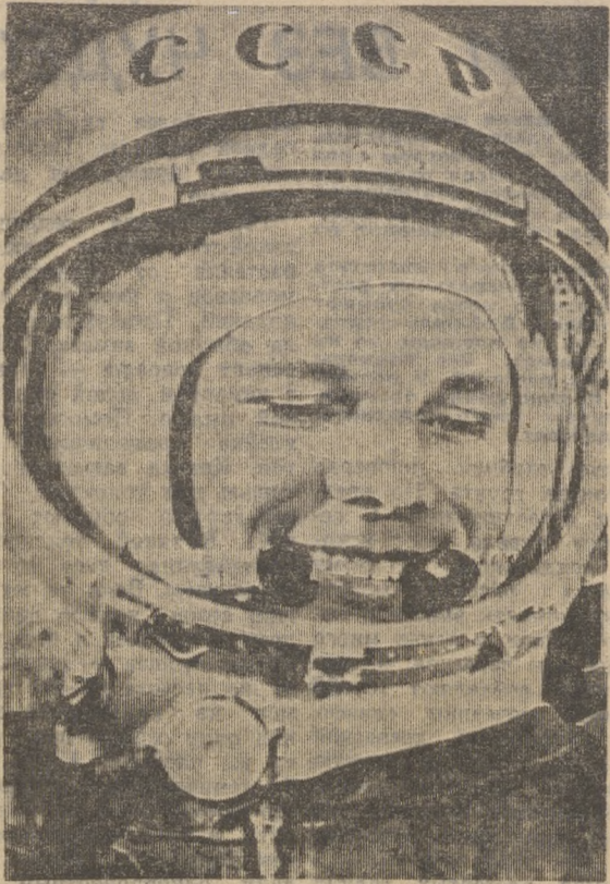
На снимке: летчик-космонавт СССР Юрий Алексеевич Гагарин.