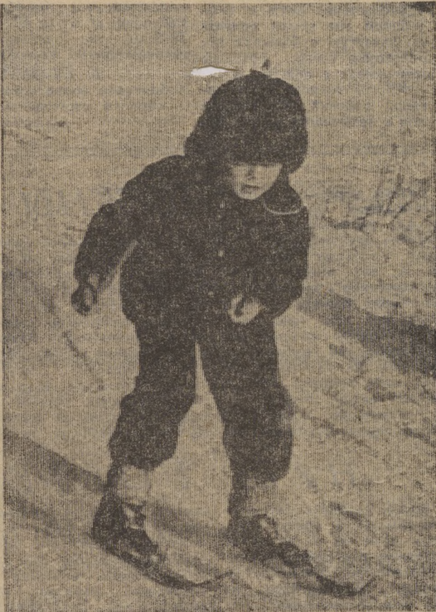
По мартовскому снегу.