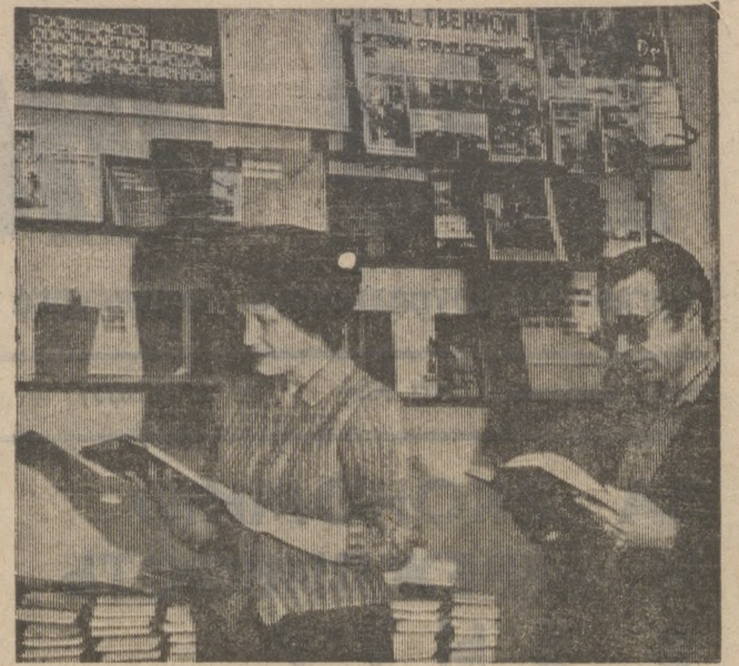
Выставки, читательские конференции, обзоры литературы регулярно проводятся в городской библиотеке. Круг их тем разнообразен. Здесь можно познакомиться с книжными новинками, почитать газеты и журналы. Работники библиотеки всегда помогут выбрать книгу.