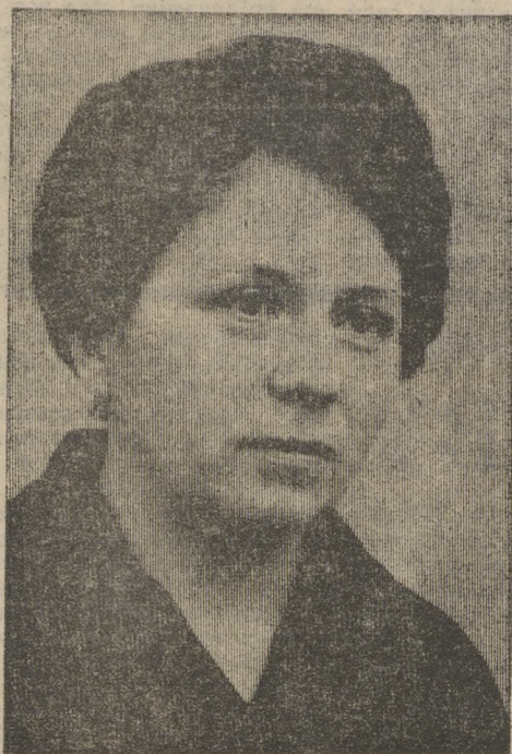
* Рассказы о кандидатах в депутаты