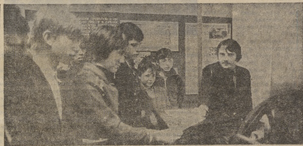
■ К 80-летию ПЕРВОЙ РОССИЙСКОЙ РЕВОЛЮЦИИ 1905—1907 гг.