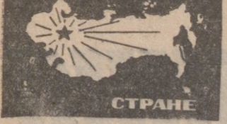
СТОЕК И ПРОЧЕН