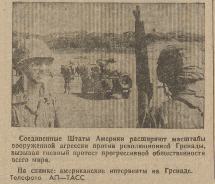
Соединенные Штаты Америки расширяют масштабы вооруженной агрессии против революционной Гренады, вызывая гневный протест прогрессивной общественности всего мира.

На снимке: американские интервенты на Гренаде.