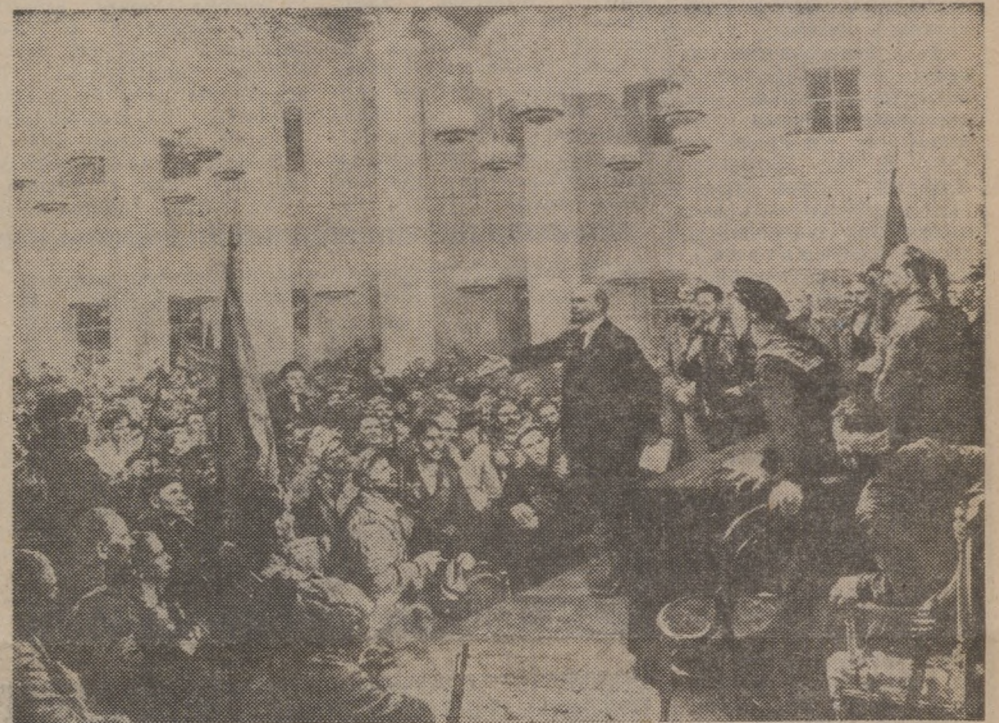
«В. И. Ленин провозглашает Советскую власть». Картина художника В. А. Серова.

Завтра праздничные колонны возглавят лучшие люди и коллективы, на которых будут равняться остальные. В праздничной колонне сильнее чувствуешь солидарность и единение с товарищами по труду, единомышленниками, острее осознаешь, какой высокой нравственной мерой надо мерить свою жизнь. Пусть вдохновляет нас в наших делах пример лучших сынов и дочерей города, Родины, пример коммунистов и сознание того, что все мы — наследники Октября.