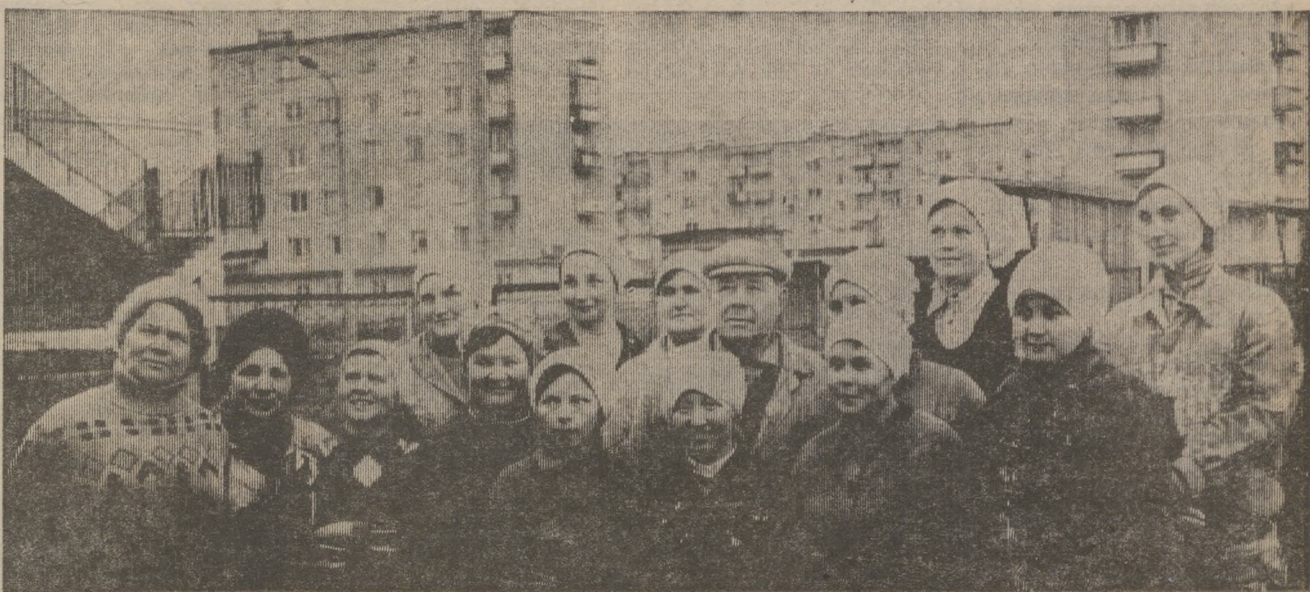
* Люди города — гордость города

Партийные, профсоюзные организации призваны в корне пересмотреть свое отношение к движению за коммунистическое отношение к труду, улучшить руководство этой созидательной силой современности. Ленинские крылатые слова «Мы придем к победе коммунистического труда!» — должны стать компасом в многогранной, повседневной работе по воспитанию в советских людях нового, коммунистического отношения к труду. На достижение этих целей ориентируют партийные, профсоюзные организации, трудовые коллективы документы июньского (1983 г.) пленума ЦК КПСС.