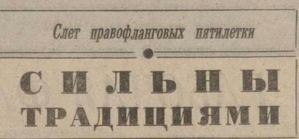
Слет правофланговых патилетки

Ветераны частично вспоминают, как ударничество входило в жизнь, ломало сложившиеся представления о роли рабочего на производстве. Луозуг «Дашевская» становился шире, масштабнее и требовал от человека более осмысленного, творческого подхода к делу. В социальствах появлялись новые пункты: появлялись качества, уменьшать затраты. И за эти скрупулы вставали глубокие перемены в жизни каждого труженника и целого коллектива. Рабочие садилась за парты вечерних школ, объединялись в новаторские группы, включались в поиск резервов высоко производительного труда.