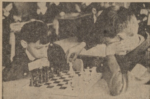
В третьей школе шахматы — всеобщее увлечение.