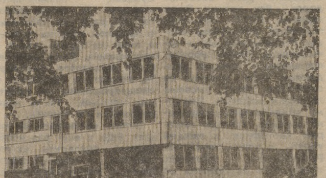
В новом административно-бытовом корпусе (вверху) разместятся административные службы некоторых производственных подразделений, бытовые помещения для рабочих на 515 мест, прачечная, где можно освежить спецодежду.