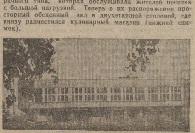
Горняки помнят ту маленькую столовую в доме барачного типа, которая обслуживала жителей поселка с большой нагрузкой. Теперь в их распоряжении просторный обеденный зал в двухэтажной столовой, где винзуд разместились кулинарный магазин (нижний снимок).