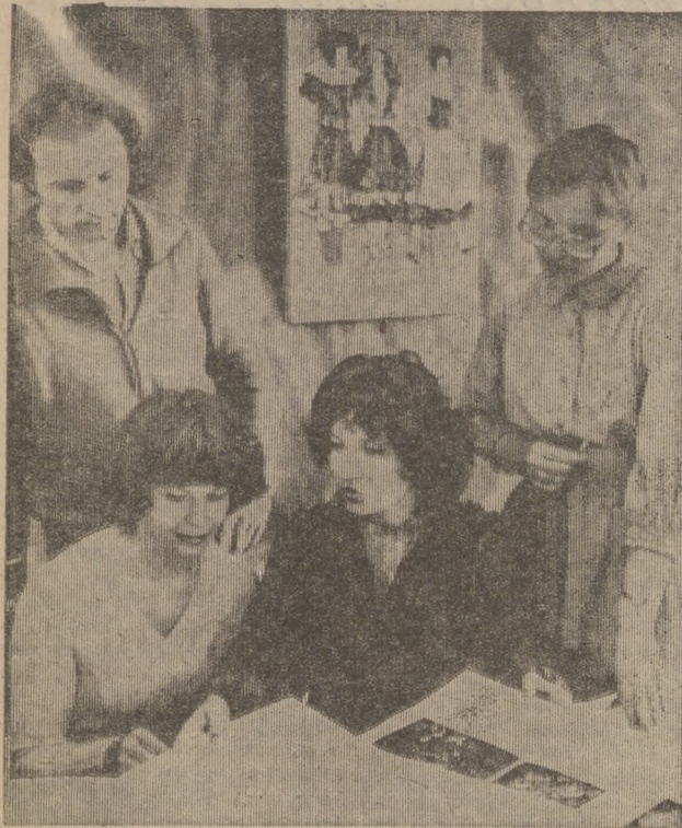
Белорусская ССР. Могилевское производственное объединение шелковых тканей постоянно обновляет и пополняет ассортимент.

Особенным спросом у покупателей пользуются нарядные плательные ткани. Художники объединения ежегодно создают десятки новинок. В частности, в нынешнем году могилевские текстильщики порадовали покупателей гладкокрашеными материалами, имитирующими натуральный шелк, подэфирной тканью «Ойра».