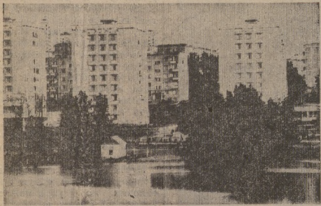
НОВОЕ ОКРУЖЕНИЕ СТАРОГО ПРУДА.