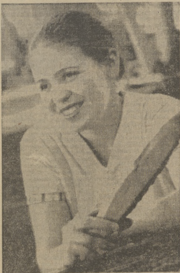
Люди города — гордость города

Вся агитационно-массовая работа должна способствовать дальнейшему подъему политической и трудовой активности трудящихся, мобилизации их усилий на успешное осуществление решений XXVI съезда партии, достойную встречу 60-летия образования СССР и юбилея Первоуральска.