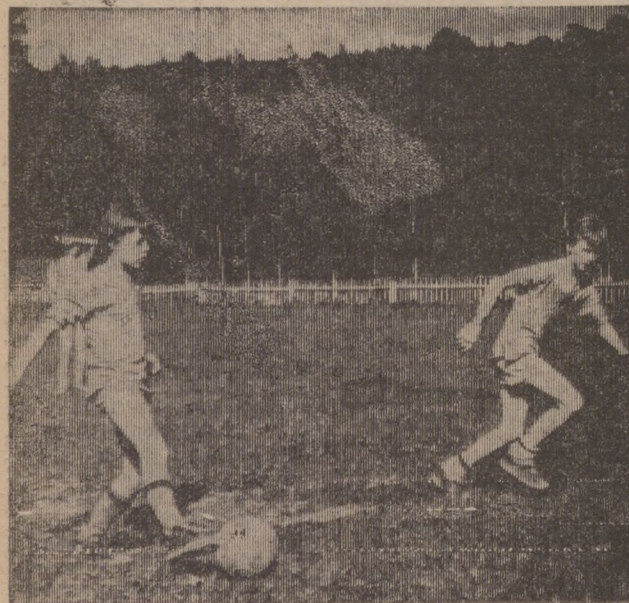
Встреча юных футболистов пионерских лагерей «Огонек» Новотрубного завода и имени Г. Титова — динасового. Атакуют дети огнеупорщиков.