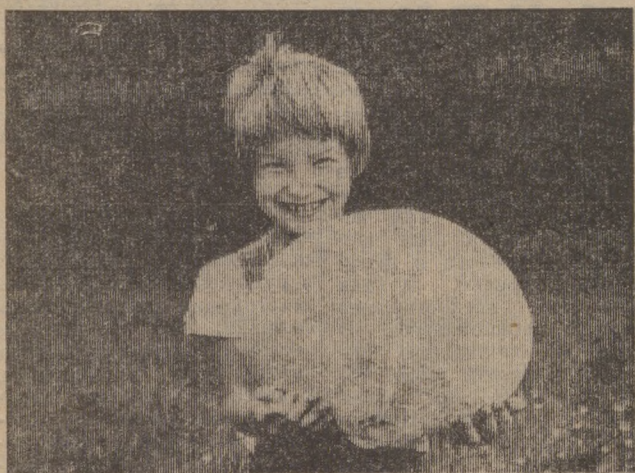
Вот какой гриб-дождевик вырос на территории детского комбината № 91! А весит он три килограмма триста граммов.

ответственный секретарь городской организации общества «Знание».