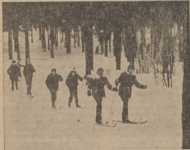
ПО МАРТОВСКОЙ ЛЫЖНЕ.