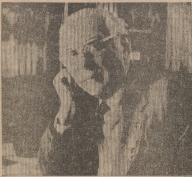
Сергей Владимирович Михалков — известный советский писатель, Герой Социалистического Труда, лауреат Ленинской премии, лауреат Государственных премий, Председатель Правления Союза писателей РСФСР, Главный редактор Всесоюзного сатирического киножурнала «Фитиль», депутат Верховного Совета СССР.