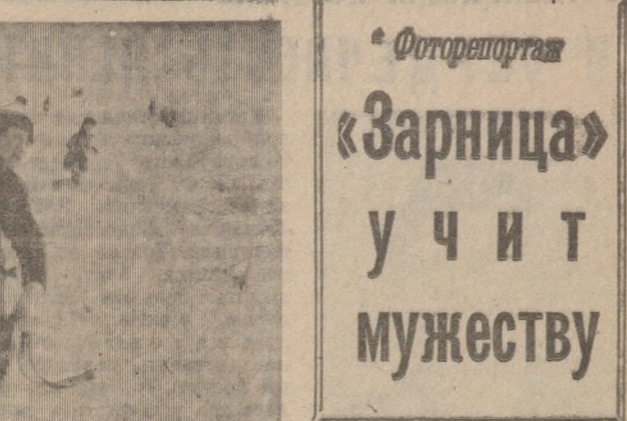
«Зарница» учит мужеству

В марте в школах политического просвещения по курсу «История КПСС» проводятся занятия, посвященные ленинскому плану построения социализма в СССР.