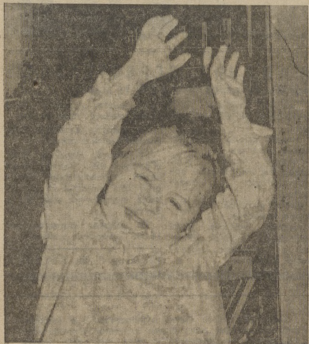
ВОТ ТАКАЯ БОЛЬШАЯ ВЫРАСТУТ

Помочь выбрать дело своим детям — первейшая родительская забота, чтобы не краснеть потом перед всем миром за неумеху, ленивого, грубого, нечестного, чтобы не ходить потом по начальству, не упрашивать за свое нерадивое дитя, которое набедокурило, не подчинилось, сорва-