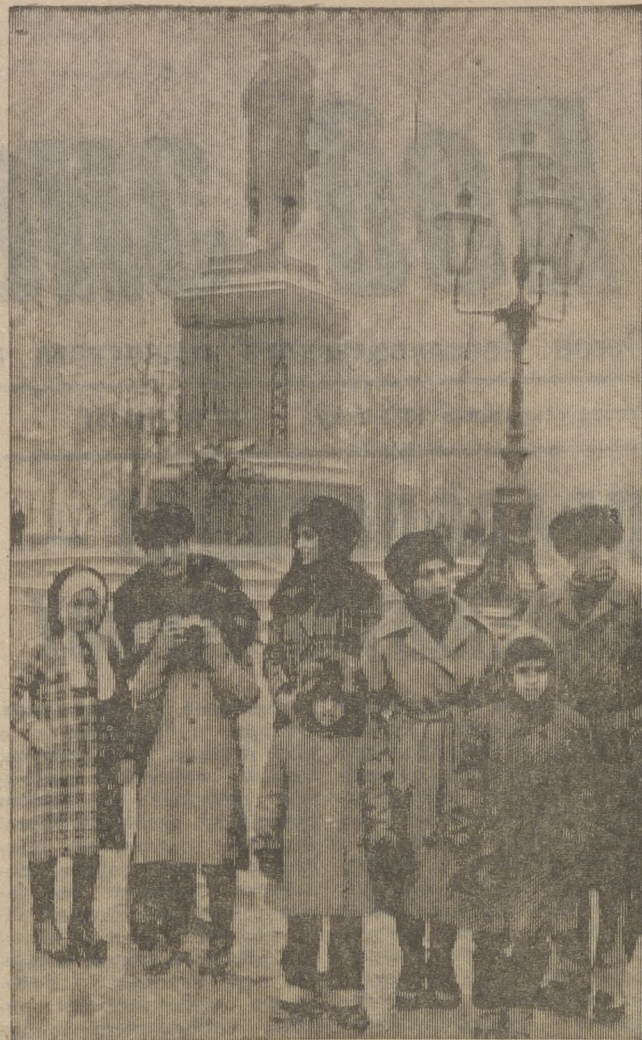
В соответствии с договоренностью между Индией и СССР два индийских космонавта в советском Центре подготовки космонавтов имени Ю. А. Гагарина готовятся к совместному советско-индийскому космическому эксперименту.

Индийские космонавты с интересом знакомятся с Москвой.