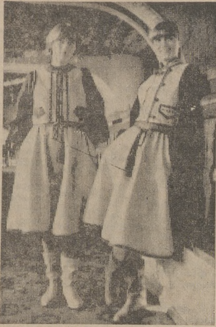
Редактор С. И. ЛЕКАНОВ.