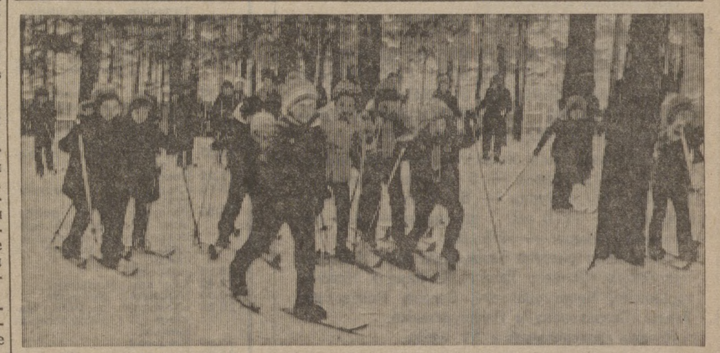
Неделя лыжного спорта, которая предшествовала Всесоюзному дню лыжника, собрала в городском парке культуры и отдыха тысячи первоуральцев. На снимке: после уроков вышли покататься в сосновом бору первоклассники школы № 6.