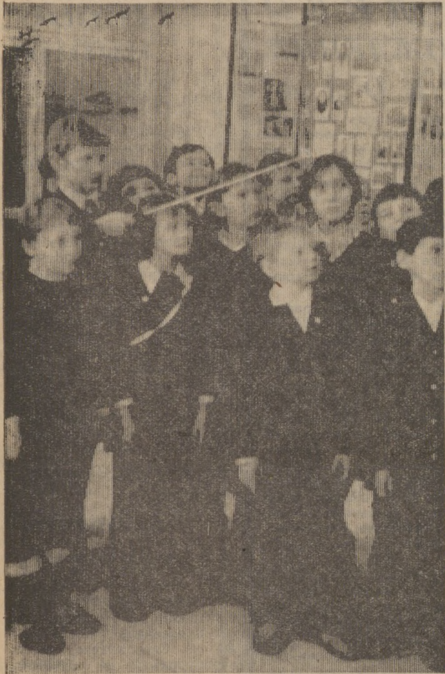
Октябрята третьей школы пришли на экскурсию в свой музей. Экскурсоводами в музее работают их старшие товарищи — пионеры.