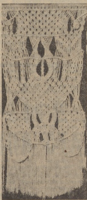
20-6, кв. 1. Справки по

С 3 февраля магазин № 7 «Галантерея» проводит выставку-продажу зажималок. Просим посетить выставку и принять участие в оценке качества товара, высказать свои замечания по ассортименту.