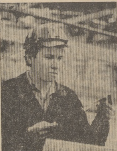
ПЯТИЛЕТКА, ГОД ТРЕТИЙ

Общественный смотр эффективности использования сырья, материалов, топливно-энергетических ресурсов и рабочего времени продолжается. Партийные, профсоюзные, комсомольские организации, хозяйственные руководители обязаны положить в основу организаторской и массово-политической работы по проведению осмотра выводы и указания Генерального секретаря ЦК КПСС Ю. В. Андропова. Только опираясь на творческую инициативу масс, развивая ее, можно успешно решить задачу снижения затрат на производство продукции, сделать массовым поход за экономную экономику.