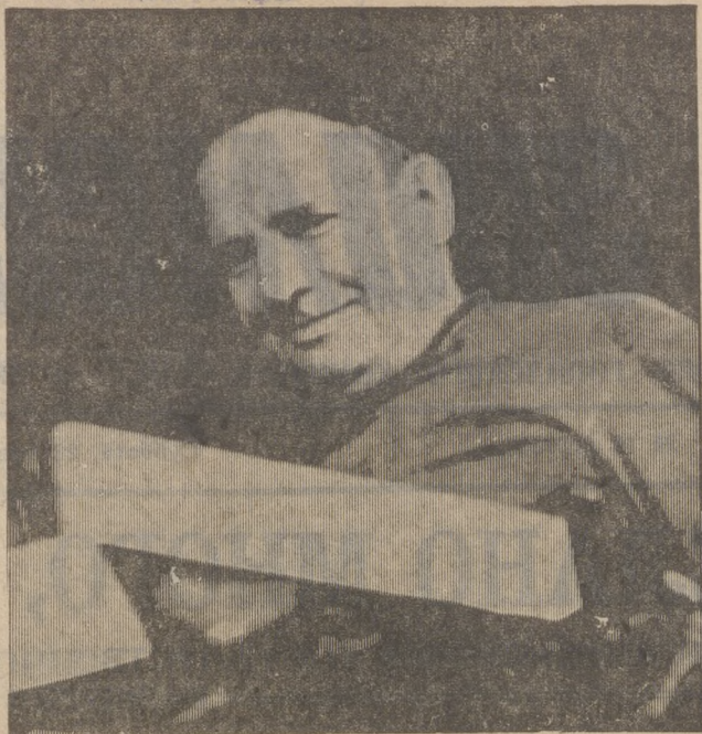
ГОРОД МОЙ ОРДЕНОНОСНЫЙ