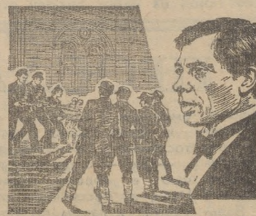
ВЛАДИВОСТОК, ГОД 1918

С 19 января демонстрирую в т с я новый цветной широкоформатный и историко-революционный фильм киностудии имени М. Горького.