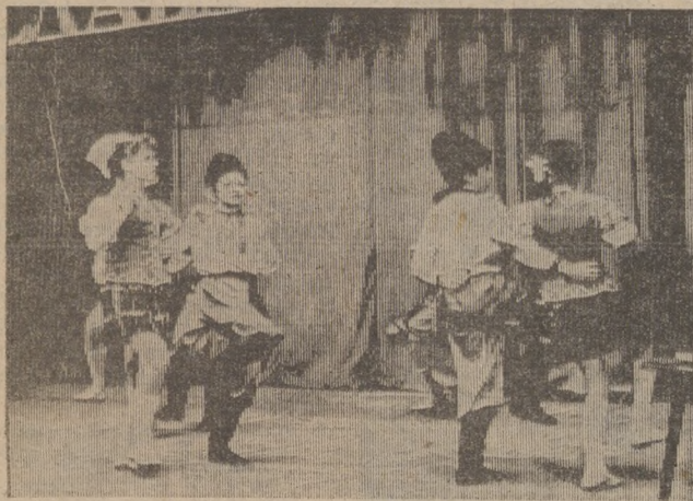
В задорном танце.