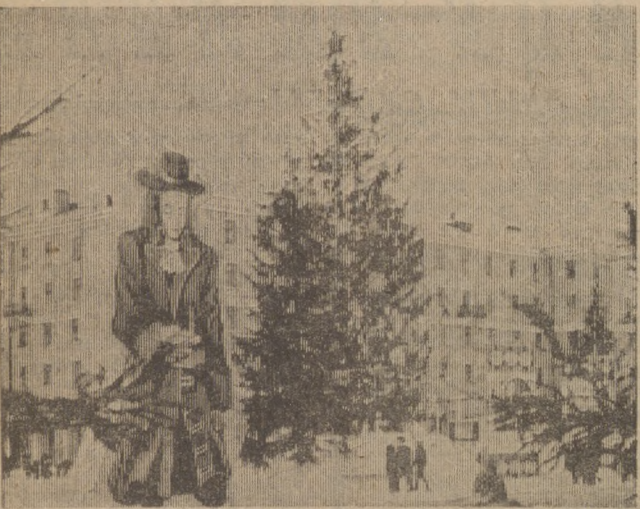
Главная елка Первоуральска.