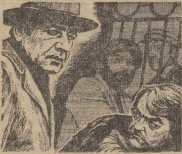
ПАРОЛЬ — «ОТЕЛЬ РЕГИНА»

С 28 декабря по 30 декабря новый цветной шедевр н и и й приключенческий фильм киностудии «Узбекфильм».