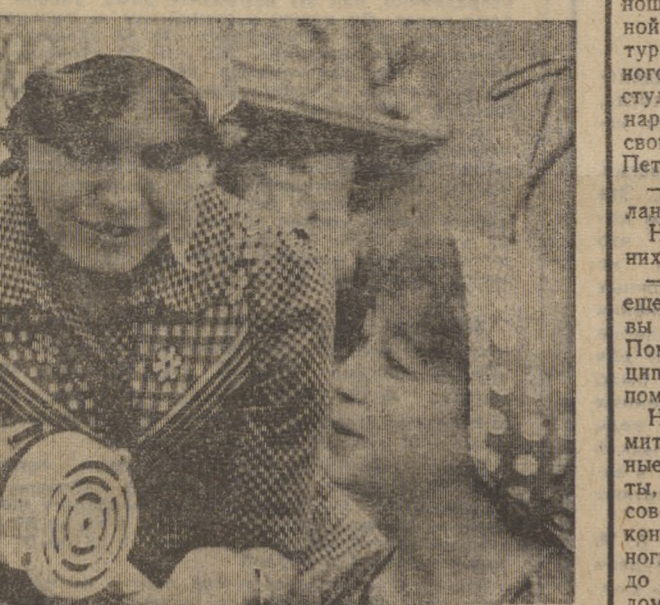
Опыт и мастерство наставников...