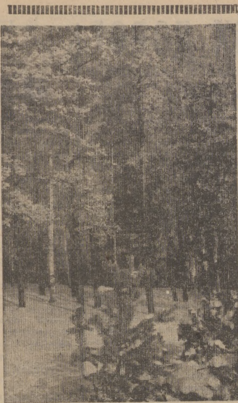
Выпал снег — и сразу в лесу стало тихо и торжественно. Не видно и не слышно его обитателей, у них свои хлопоты: зиму встречают.