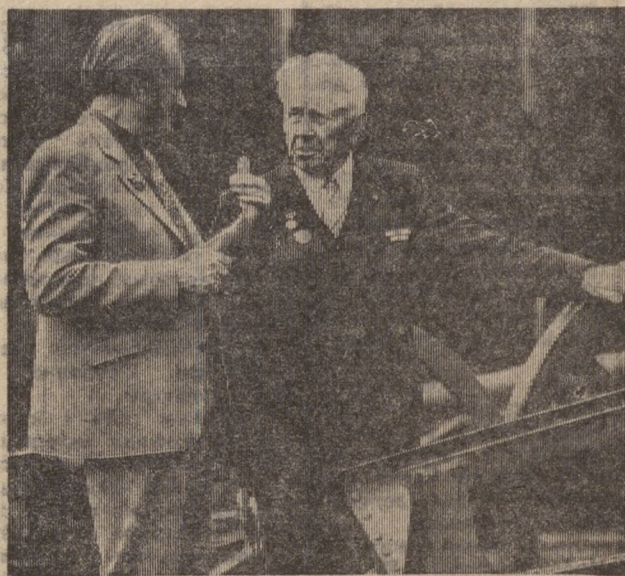
13 ОКТЯБРЯ ИСПОЛНЯЕТСЯ 40 ЛЕТ СВОБОЖДЕНИЯ ЛАТВИИ ОТ НЕМЕЦКО- ФАШИСТСКИХ ЗАХВАТЧИКОВ

На 1 апреля 1984 года звания Героя Советского Союза удостоено свыше 12,5 тысячи человек. Дву-