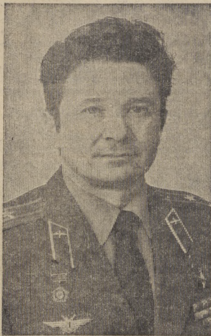
Командир космического корабля «Союз Т-10» летчик-космонавт СССР Герой Советского Союза полковник КИЗИМ Леонид Денисович.