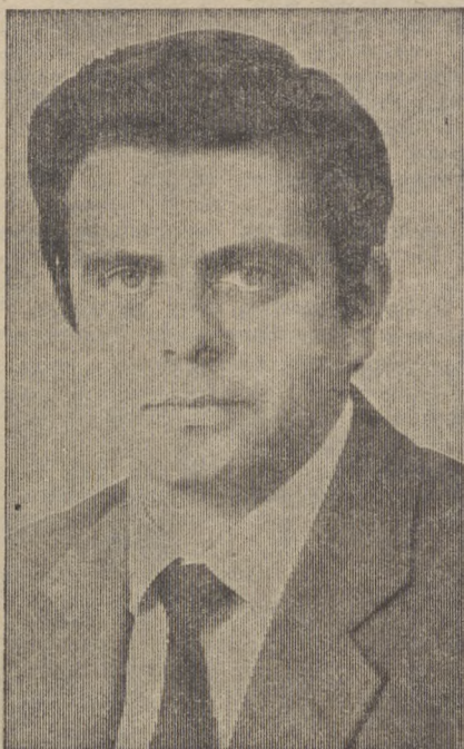
Бортинженер космического корабля «Союз Т-10» СОЛОВЬЕВ Владимир Алексеевич.