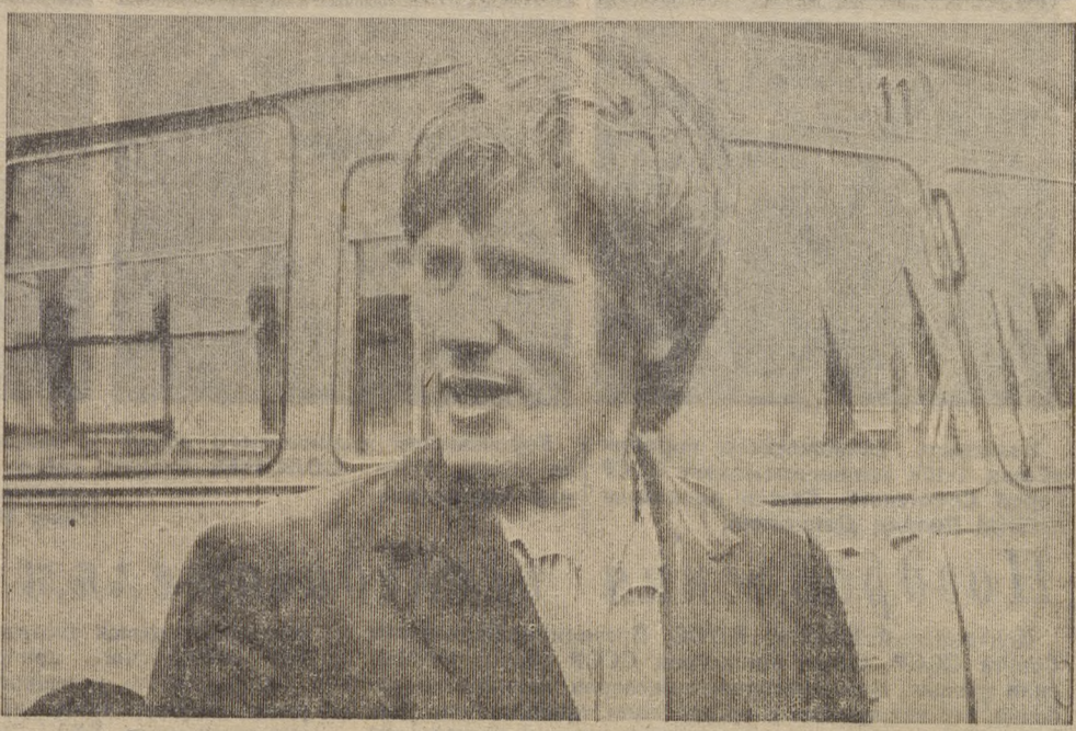
* Конкурс водителей автобусов. Главный арбитр — пассажир