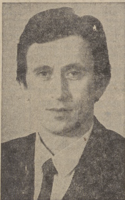
Космонавт-исследователь космического корабля «Союз Т-10», врач, кандидат медицинских наук АТЬКОВ Олег Юрьевич.