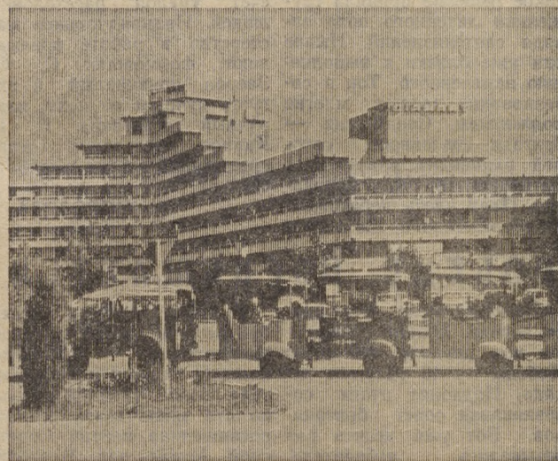
СРР. Тысячи румынских граждан и гости из-за рубежа проводят свой отпуск на черноморском побережье республики. К их услугам 12 курортов с современными гостиничными комплексами, санаториями, домами отдыха, кемпингами, плавательными бассейнами и замечательными песчаными пляжами. На снимке: новый гостиничный корпус «Диамант» на курорте Сулина.

В интересах населения две эти проблемы нам необходимо решать быстрее.