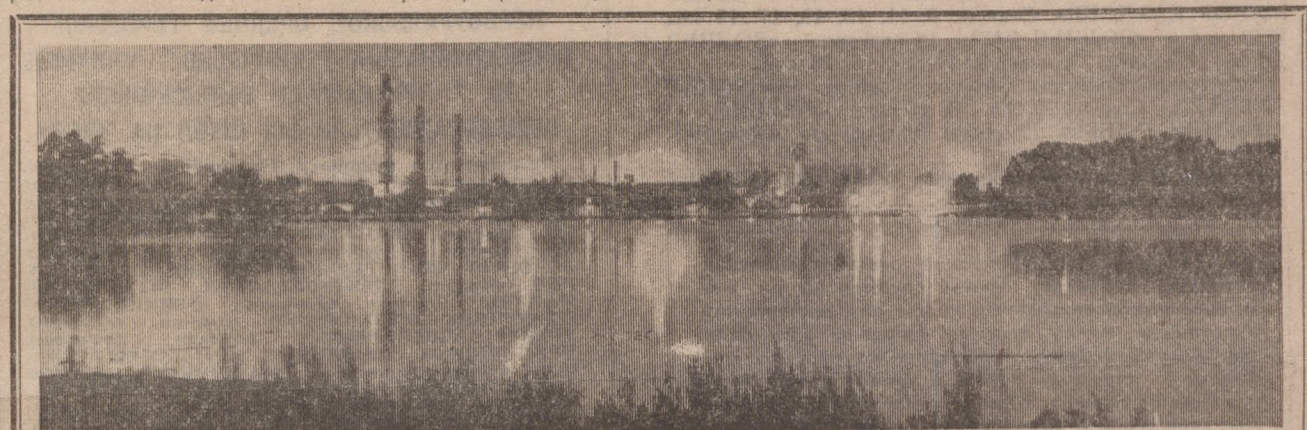
На снимке: Первоуральск, промышленный пейзаж. Филиал Новотрубного завода.