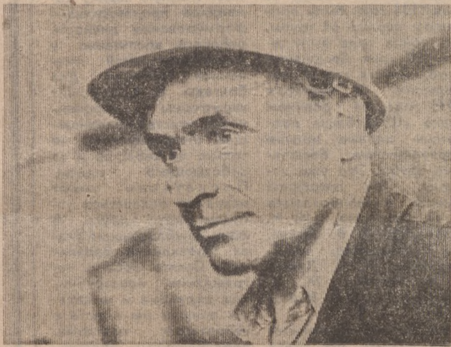
Фото А. Кадочникова.

* Идет смотр: за экономию и бережливость