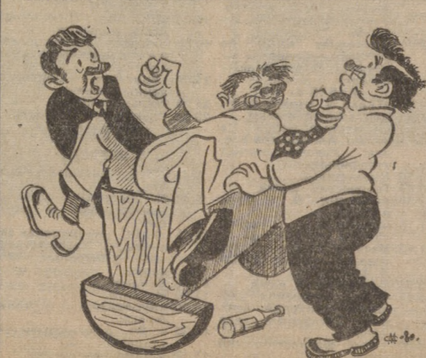
— Почему не воспитываете меня! Рисунок М. Скитина.

Надо лечиться. Медицинская помощь и ваше желание заставят отступить бокалезнь.