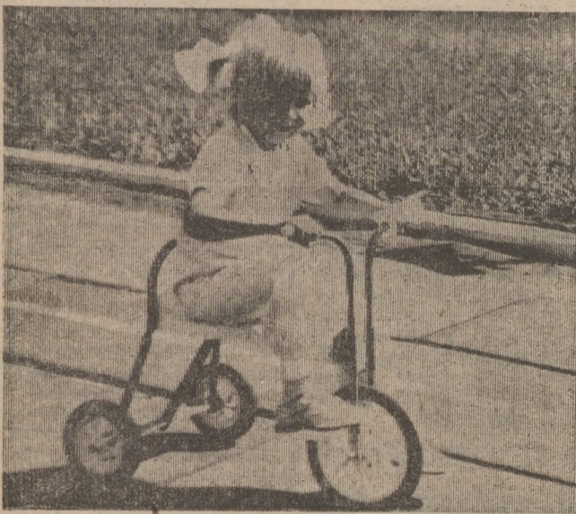
На старт вызываются спортсмены на трехколесных велосипедах.