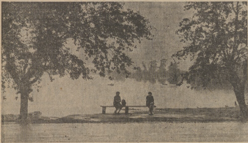
На берегу Нижнего пруда.