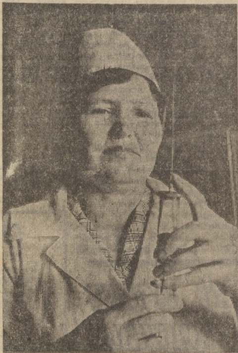
■ ИЗ ПОЧТЫ РЕДАКЦИИ