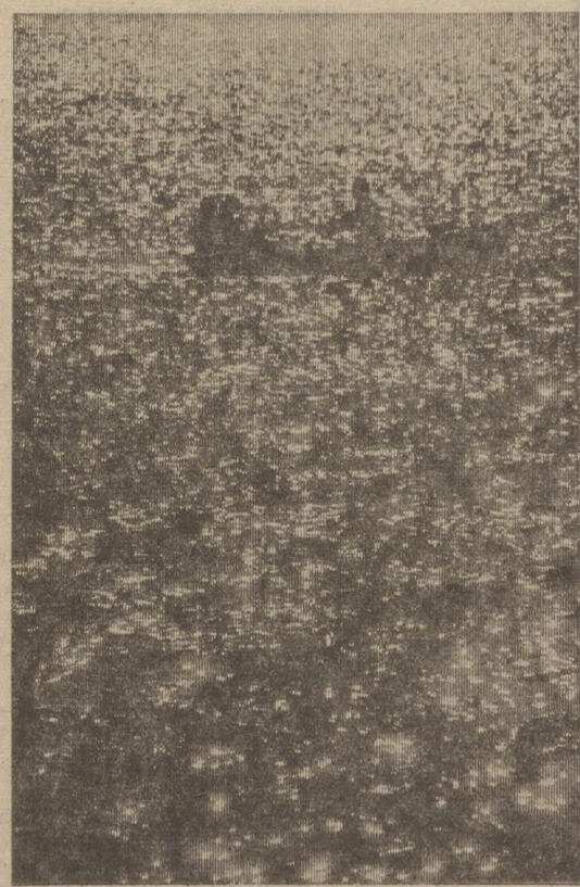
Солнечный дождь.

Красив наш город летом, есть где отдохнуть, посмотреть спектакль или фильм. Но для того, чтобы пойти куда-нибудь, надо брать с собой бидон с водой, иначе умрешь от жажды. Квасных цистерн так мало, что возле них огромные очереди, сатураторных тележек нет, автоматы для газированной во-