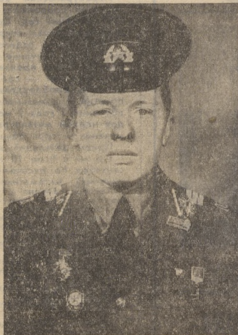
Служат наши земляки