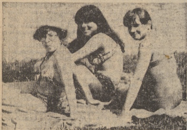
В жаркий день на городском пруду.

председатель городского клуба любителей бега «Надежда».