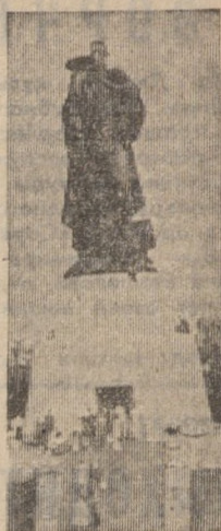
Мемориальный комплекс в берлинском Трептов-парке увековечивает подвиг советского солдата, разгромившего гитлеровский фашизм и принесшего мир на землю Европы.

Сегодняшняя страница рассказывает о сыновьях Отчизны разных поколений. Духовная связь между ними все так же неразрывна. Эстафета ратной доблести во имя счастья, свободы и мира продолжается.