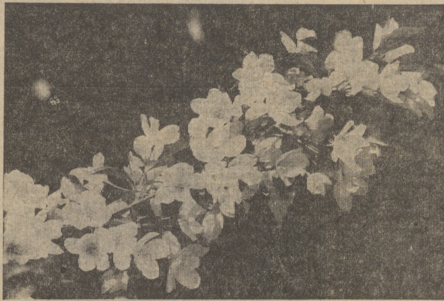
ЯБЛОНИ В ЦВЕТУ.

зам. председателя комиссии профкома Новотрубного завода по вопросам труда и быта женщин.