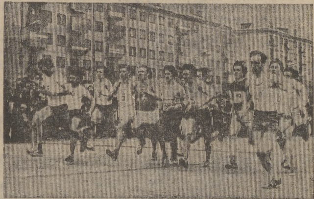
На снимке: старт одной из прошедших эстафет.

В ТРЕТЬЕЙ ГРУППЕ — сборные команды цехов предприятий. В ЧЕТВЕРТОЙ ГРУППЕ — команды училищ профтехобразования и средних школ. Команды, занявшие первые места в своих группах, награждаются кубками газеты «Под знаменем Ленина» и почетными грамотами. В связи с тем, что эстафета юбилейная, кубки редакции остаются в спортивных коллективах на память. Спортсмены команд, добившихся лучшего спортивного-технического результата, награждаются лентами чемпионов эстафеты и годовой подпиской на городскую газету «Под знаменем Ленина». СПОРТСМЕНЫ, НА СТАРТ!