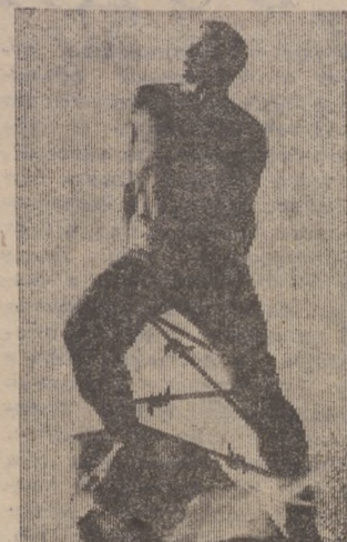
Моабитские тетради Мусы Джалиля. Как драгоценные реликвии хранят их земляки татарского поэта, чье имя стало символом бесстрашия и стойкости со-