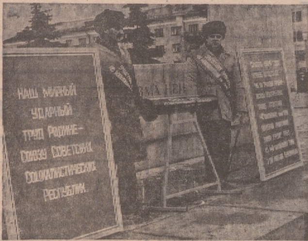
(Окончание. Начало на 1 стр.)

На Новотрубном заводе прокатана сорокамиллионная тонна труб